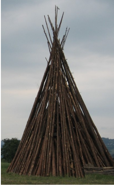
Zwei vorbildlich aufgebaute Johannisfeuer im Landkreis Kronach